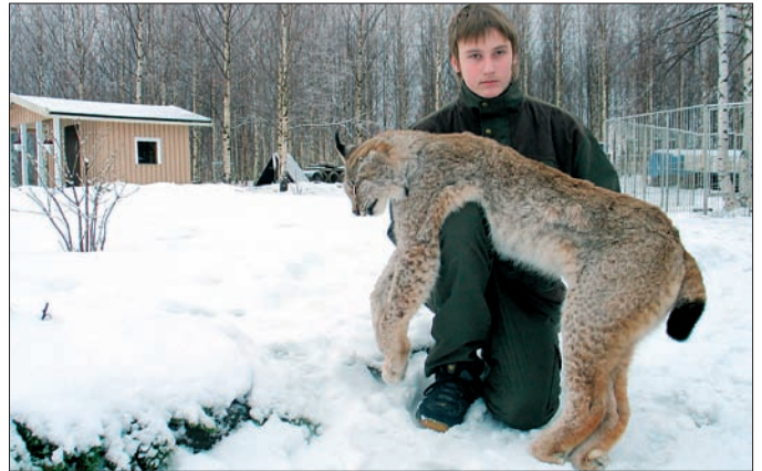
Mikon kaatama naarasilves painoi seitsemäntoista kiloa.

Lähes välittömästi ajon käynnistyttyä ilves kuitenkin