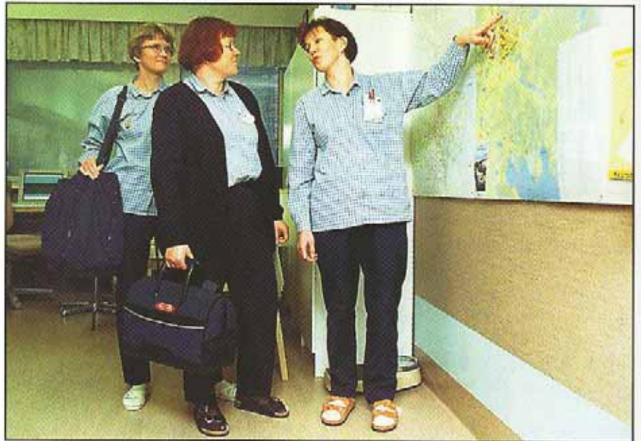
Kotisairaalan henkilöstö lähdössä "keikalle".

Jokilaakson sairaalan sisätautiosasto 2:n alaisuudessa toimiva kotisairaala aloitti toimintansa.