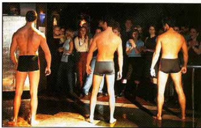
Jämsäläisravintolassa käytiin Mr. Jämsä -kisat.