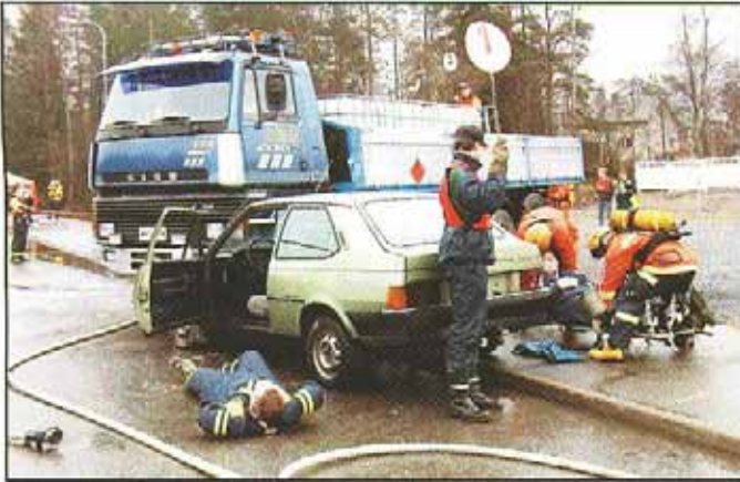
Liekkomaljan taito-osiossa mitattiin palokuntien kykyä selviytyä kolaritilanteesta.