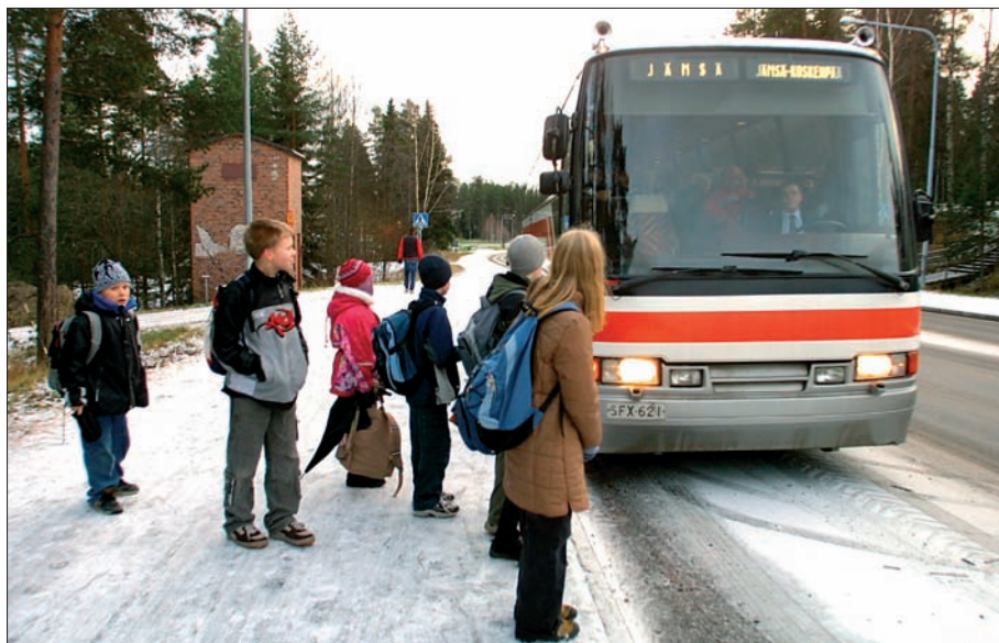
Bussilakko vaikeutti muun muassa koulukyytien sujumista.