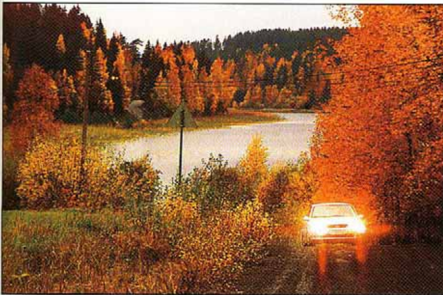
Sammallahdelle ryhdyttiin suunnittelemaan tasokasta asuinalueita.