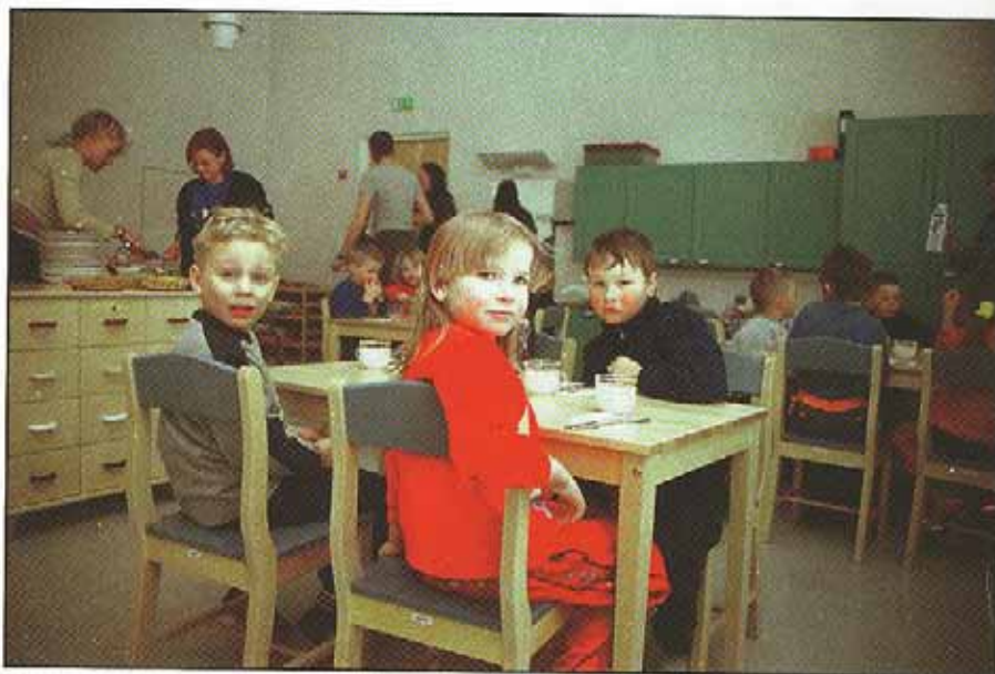
Uuden päiväkodin ensimmäinen lounas alkamassa.