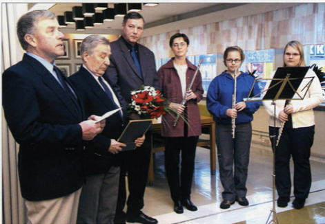
Jämsänjokilaakson Soittokunnan edustajat ottivat vastaan Jämsänkosken kulttuuripalkinnon.

Soittokunnan ohjelmistoa kilitettiin myös monipuoliseksi.