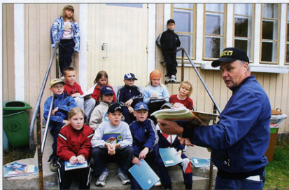
Partalan ala-aste oli yksi selvittelyyn piiriin kuulunut koulu.

Oppilasta kohti kustannukset kyläkouluissa olivat selvästi taajamkouluja suuremmat.